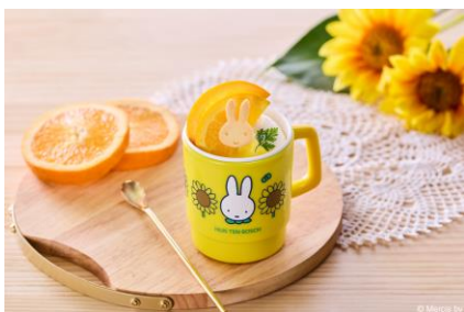
ミッフィーのオレンジアイスパフェ