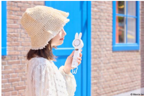
miffy ペルチェ付きハンディファン（7月中旬発売）

さらにスーベニア付きのアイスクリームやパフェ、さっぱりとした味わいのソーダやレモネードも登場。昨年よりパワーアップしたラインナップでかわいいも、冷たいも、美味しいも叶えます。