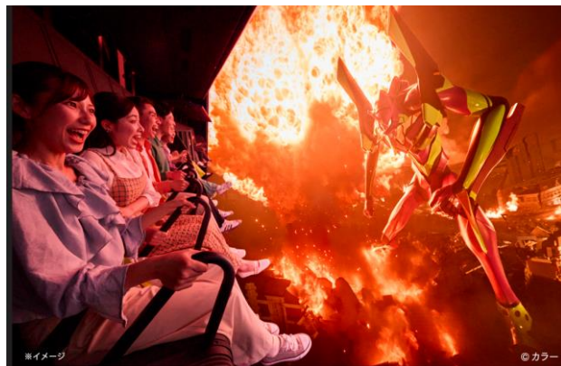
エヴァンゲリオン・ザ・ライド - 8K -