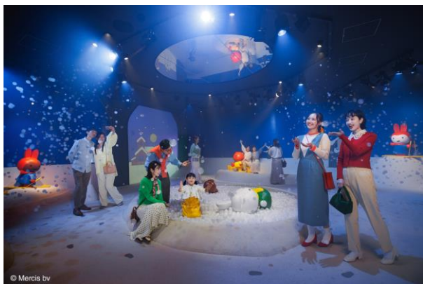
ミッフィーのドリームストーリーブック