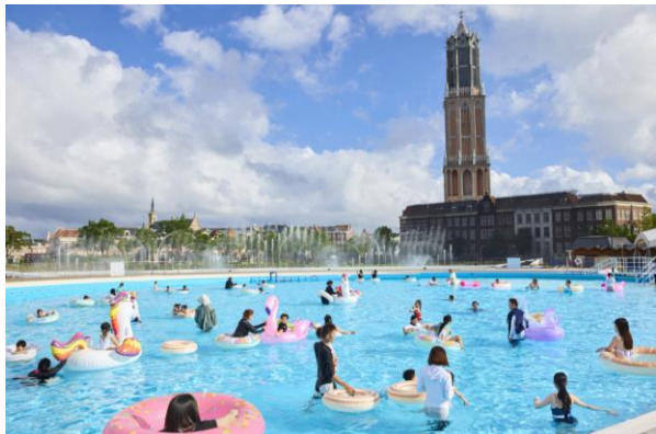
グランドサマープール

※ヨーロピアン・アクアラグーン、メガスライダーは7月17日（金）よりオープンいたします。