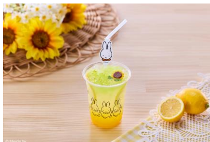
ミッフィーのひまわりソーダ