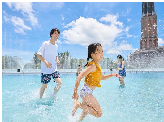
スプラッシュ・フィールド