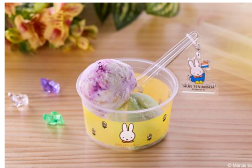
ミッフィーアイス(チャーム付き)