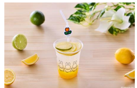
ミッフィーのしゅわしゅわレモネード