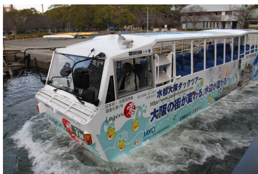
（大阪で運行中の40人乗バス）