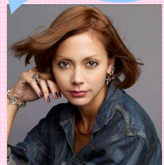
スペシャルアーティスト 土屋アンナ