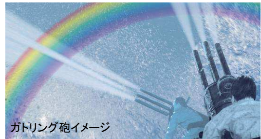
ガトリング砲イメージ