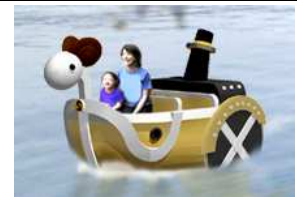
ミニメリー号イメージ