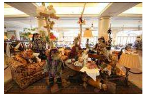
↑ ホテルヨーロッパロビー装飾