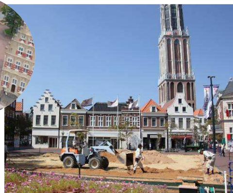
「花の巨大地上絵」施工の様子 (15日現在)