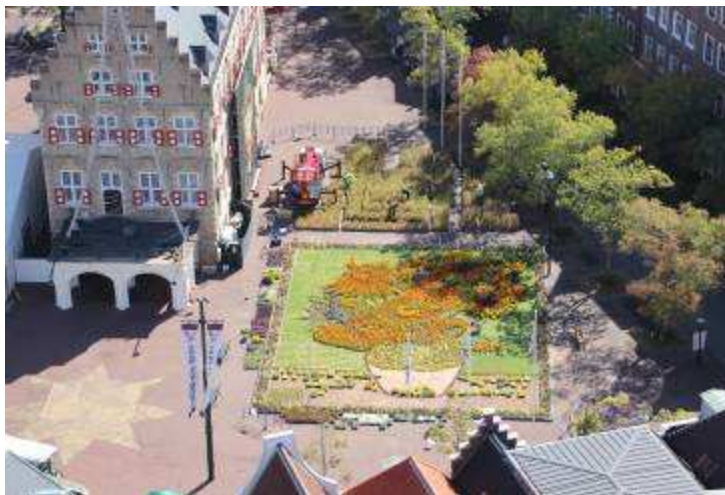
秋の花で制作する「巨大壁画」と「巨大地上絵」の施工中の様子（24日現在）

ハウステンボスでは、10月27日(土)から開催する「花と芸術祭」にお目見えする巨大芸術作品の完成が間近となりました。15日(月)からキャンバスの制作から開始して12日間かけて登場。26日の完成を目指して、順調に花や木の実など秋の素材を使用して制作中です。