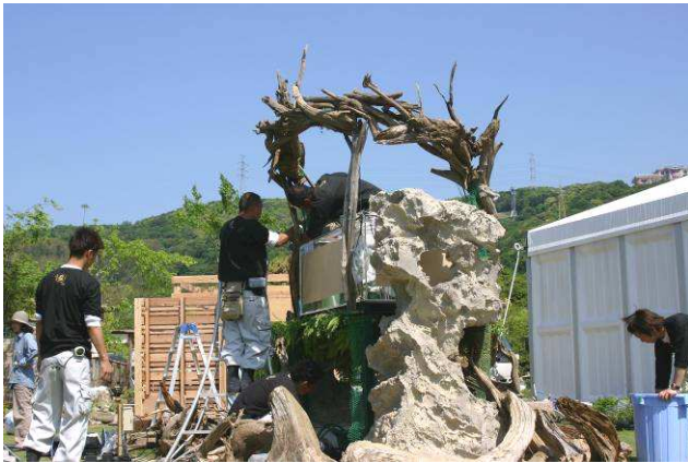
【昨年の国内予選、作品制作風景】