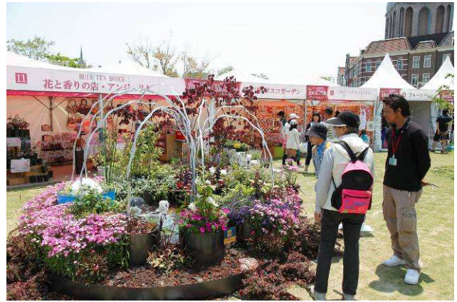
【昨年の作品展示時の様子】