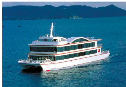
【ロイヤルクルーザー「デハール」】