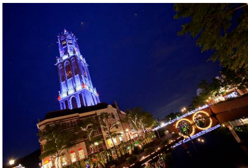
【青にライトアップされるドムートルン】

昨年、日本ロマンチスト協会が制定する世界初の「ロマンティックヘリテージ(後世に残したいロマンス遺産)」に第1号として認定されたランドマークタワーのドムートルン。日没後は6月限定でブルーにライトアップします。この街並みを背景に大村湾へと繰り出すクルーズ船で初めての婚活パーティーを企画しました。波穏やかな大村湾へのサンセットクルーズと船上パーティーを楽しんだ後は場内へ繰り出すことも可能。日本最多の650品種のあじさいが彩る並木道を散策したり、音楽広場でコンサートもお楽しみいただけます。ロマンティックに演出された場内の効果で、お目当ての人ともお近づきになるチャンスは倍増です。ぜひ、ハウステンボスならではのLOVEコンへご参加ください。