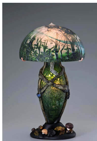
【飾壺 新世紀ロマン 金・プラチナ彩 「照葉の仲間たち」】