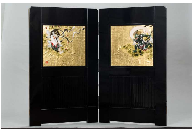
【屏風 依屋宗達画「風神雷神」フレーム：本漆】

繊細で迫力ある日本画が、透明感のあるガラスで表現される見ごたえのある作品から、黒木氏の魅力を存分に感じていただける展覧会となります。