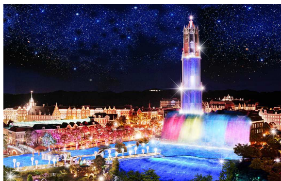
【ドムトールンから溢れ出す「光の滝」】

つきましては開幕に先駆け、報道関係者の皆様向けにイルミネーションの試験点灯を 10 月 28 日（水）に実施いたします。イルミネーションを多様に満喫いただけるように年々進化を遂げる「光の王国」。今年お目見えする 2 大スポットをどうぞ、体験ご取材ください。