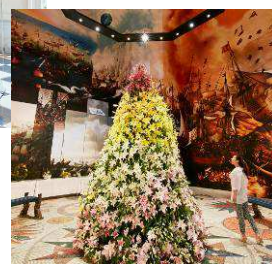
昨年の「ゆりの宮殿」前庭と館内フラワーデザインの様子。