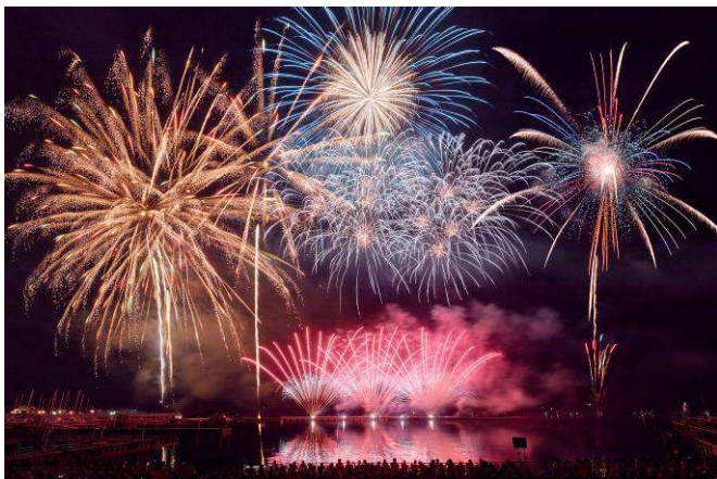
▲ウォーターマーク会場は勝敗を決める投票に参加可能！