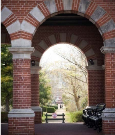
街角も画になるスポットがいっぱい