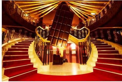
撮影可能なアトラクション館内も