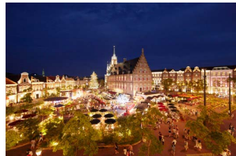
街並みのライトアップも幻想的です