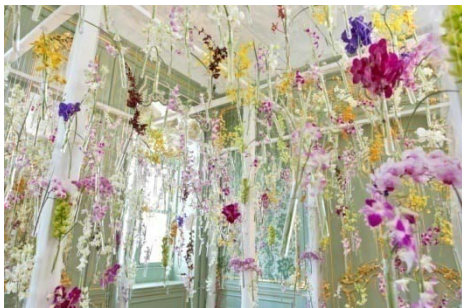
開催中の「大胡蝶蘭展」で花に囲まれながら