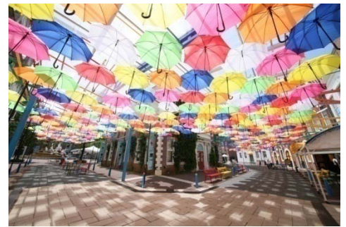
100本の傘が浮かぶ人気スポット