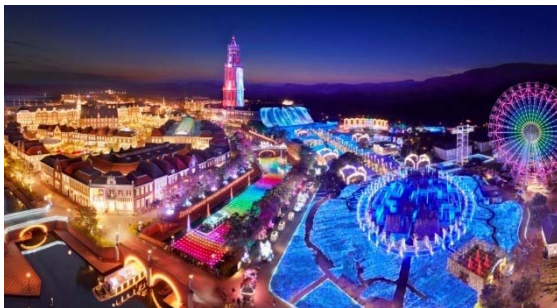
夜は世界最大のイルミネーションが舞台