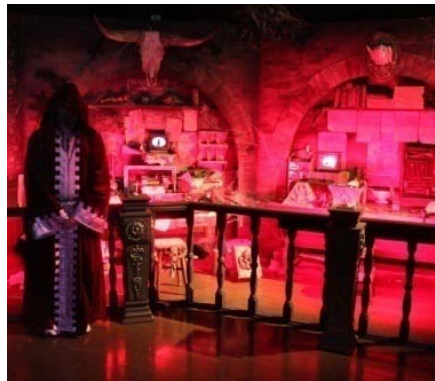
事前申し込みで入場可能なスポットや 今回特別に貸切スタジオも登場 ※写真はイメージ