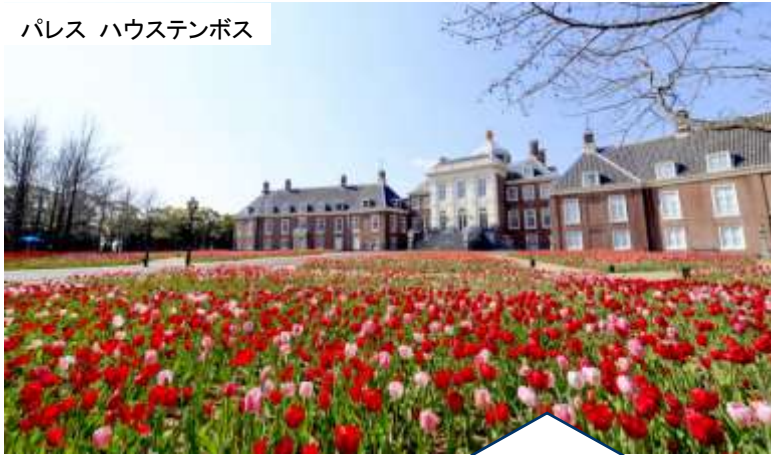
パレス ハウステンボス