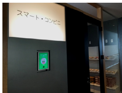
スマート・コンビニ入口の様子