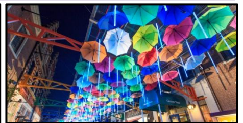
『光のアムブレラストリート』