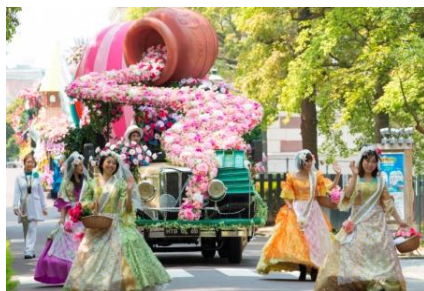
フラワーフェスティバル