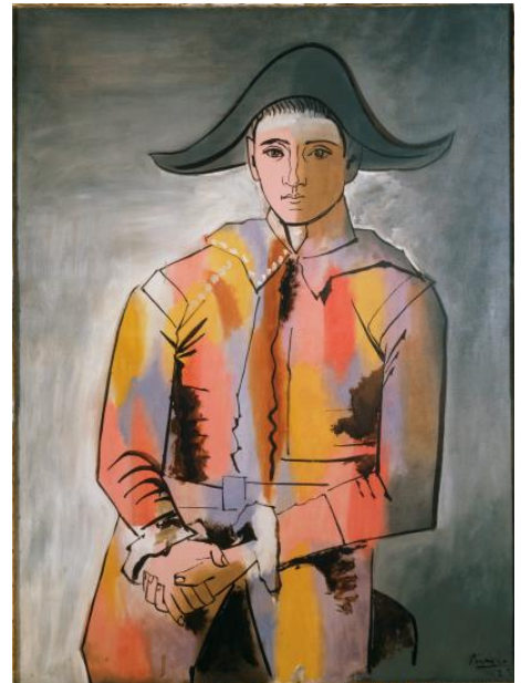
「手を組んだアルルカン」 1923年