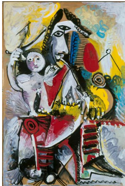
「銃士とアモール」 1969年

© 2020 - Succession Pablo Picasso - BCF(JAPAN)