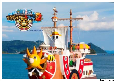
ONE PIECE サウザンド・サニー号クルーズ 2nd