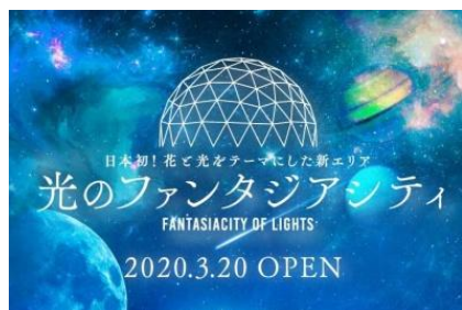
光のファンタジアシティ

アトラクションは旅行のプランに合わせて組み合わせは思いのまま、約50施設のアトラクションと期間限定のイベントや、歌劇・ミュージカル、美術館を1DAYパスポートでご利用いただけます。