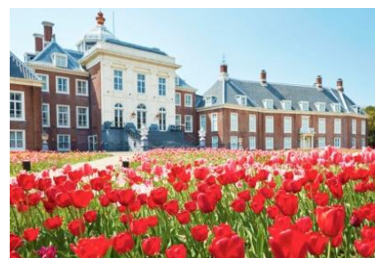
100万本の大チューリップ祭