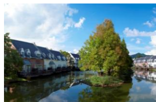
フォレストヴィラ