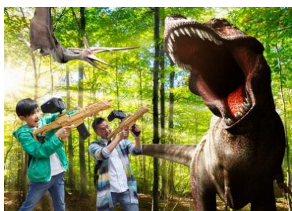
ジュラシックアイランド