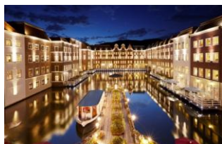
ホテルヨーロッパ

1日では遊び尽くせないアトラクションやイベントが盛りだくさんのハウステンボスでは、宿泊がおすすめです。すべてが贅沢なプレミアムホテルの「ホテルヨーロッパ」やパークの中に泊まれる唯一のホテル「ホテルアムステルダム」、家族・グループにおすすめの森に包まれた別荘型ホテル「フォレストヴィラ」、世界初のロボットホテル「変なホテル ハウステンボス」などお客様のニーズに合ったホテルが充実しており、時間を気にせず1日中お楽しみいただけます。