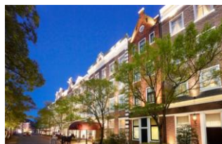
ホテルアムステルダム