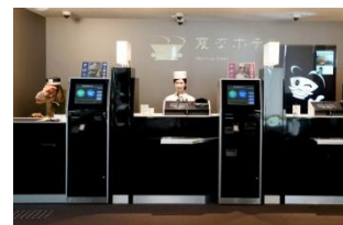
変なホテル ハウステンボス

【お客様のお問合せ先】 ハウステンボス総合案内(ナビダイヤル) tel 0570(064)110