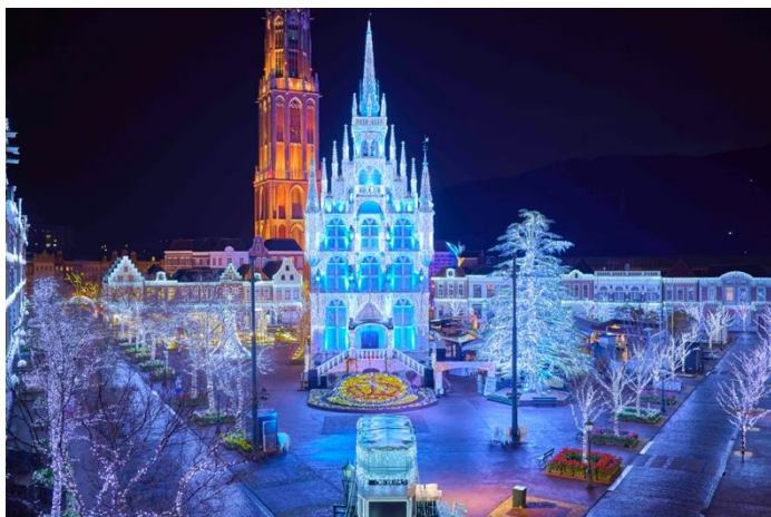
〈白銀の世界メインスポット〉

長崎・ハウステンボスは、11月6日(土)から本場ヨーロッパのような幻想的な冬シーズンを迎えます。12月26日(日)までは「光の街のクリスマス」を開催。美しい教会や宮殿がたたずむヨーロッパの街並みで、本場さながらのクリスマスを楽しめます。さらに、12月27日(月)から2022年2月25日(金)までは「白銀の街～ロマンティックヨーロッパ～」を開催し、イルミネーションがバージョンアップ。今年新たに「白銀プロムナード」が登場し、世界最大のイルミネーションが輝くハウステンボスでロマンティックな冬のひとときを過ごしていただけます。